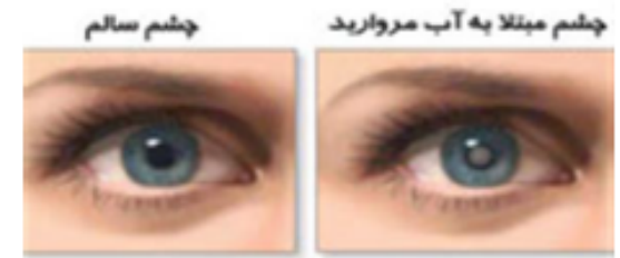
آب مروارید عبارت است از کدر شدن عدسی چشم

آب مروارید به کدر شدن عدسی چشم می گویند. عدسی یا لنز مانند لنز دوربین کار می کند و نور را بر روی پرده شبکیه که در عقب چشم قرار دارد متمرکز می کند و شخص می تواند هم دور و هم نزدیک را ببیند. عدسی به طور عمده از آب و پروتئین تشکیل شده است. پروتئین ها طوری قرار گرفته اند که باعث شفافیت عدسی می شوند، در نتیجه نور از آنها عبور می کند.